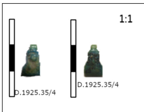
Figura 1. Amuleto representando la cabeza de una diosa. Imagen modificada a partir de la disponible en el Museo y Galería de Arte Hunterian. Universidad de Glasgow, catálogo online 3 .

A nivel socio-religioso, la construcción de la nueva capital supuso el aumento de impuestos. Además, Akhenatón colocó a sus allegados en los puestos clave de la administración, y muchos de ellos desconocían los deberes propios de su ejercicio, ello derivó en que se les conociera como los “Sin nombre”. Esta forma de nepotismo causó descontento en la población (Souto 2019, 3). Asimismo, los cambios en la esfera religiosa, tales como la supresión de la adoración, la unción, la purificación con agua o la ofrenda de Ma'at (Souto 2017, 38) también trajeron consigo ciertas desavenencias, en especial por parte del sacerdocio. El abandono a un segundo plano del culto a Osiris, evitando la mención de Anubis y sus epítetos caló hondo en una sociedad que realizaba procesiones religiosas en honor de estos dioses desde antiguo (Gestoso Singer 2002, 177-179). Con todo, no es de extrañar que, en el ámbito privado, por ejemplo, amuletos en honor a Bes, Taweret o dioses similares apelados en busca de protección o con objeto de plegarias hayan aparecido en las casas de Tell el-Amarna (fig. 1). Sin embargo, también es cierto que las tumbas de los altos dignatarios, así como algunos relieves de las casas de los oficiales (como Panehesy) estaban dedicados a Akhenatón, su familia y la adoración de Atón (fig. 2).