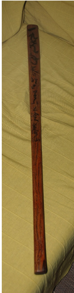
Figure 2. Keisaku given by Taisen Deshimaru to the Zen dojo in Seville.

We are bordering on the kind of violence that Marx understood as the founding violence of religion and associated with the stupefying alienation that constituted the deception of belief, proposing that religions alleviate the pain of living, like opiates that act on breathing but eventually lead to suffocation. But we should remember that religions also stimulate other trances that produce effects similar to more psychedelic substances (less psychodulic) and, from the usual mechanisms of human interaction, seek to show paths that are much less manipulable. These are the ecstatic religions (Lewis 2002), so difficult to subject to reductionist schemes, where religious action can seem extremely violent as at possession ceremonies with their dislocated identities and many voices. But trance may also go practically unnoticed, though marked by the internal violence that dictates progress along the paths to meditation. Such paths seem to be no less ecstatic than those imaginarily revealed, for example, by divine mediation through the gift of Dionysos, Huichol hikuli or the Rigvedic consumption of Soma's presence.