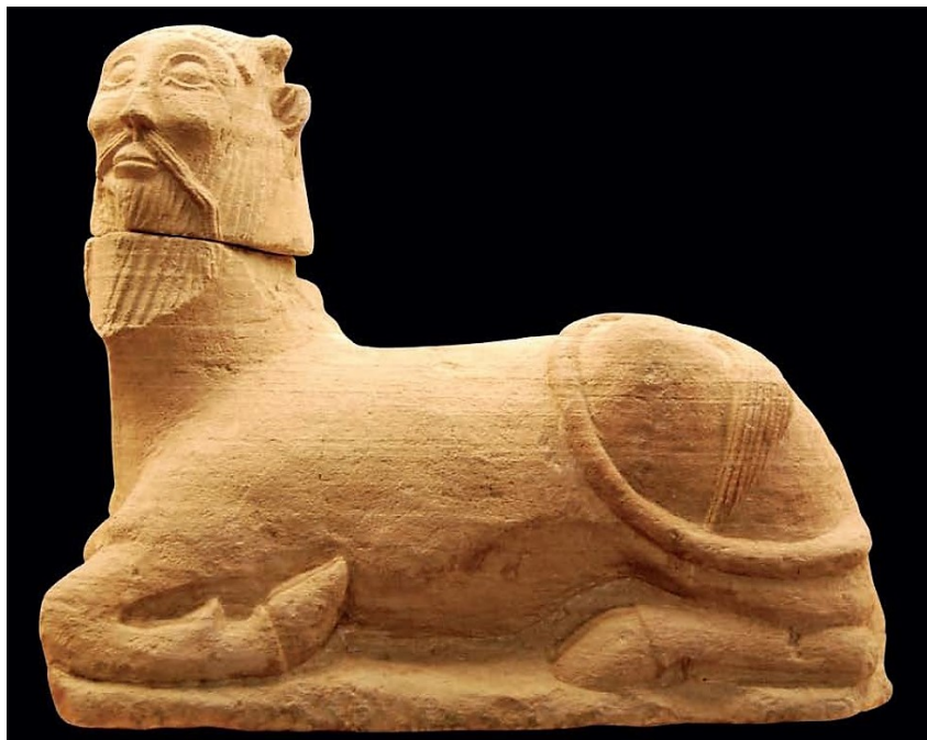
Figura 2. Bicha de Balazote. Mata et al. 2014: 153.