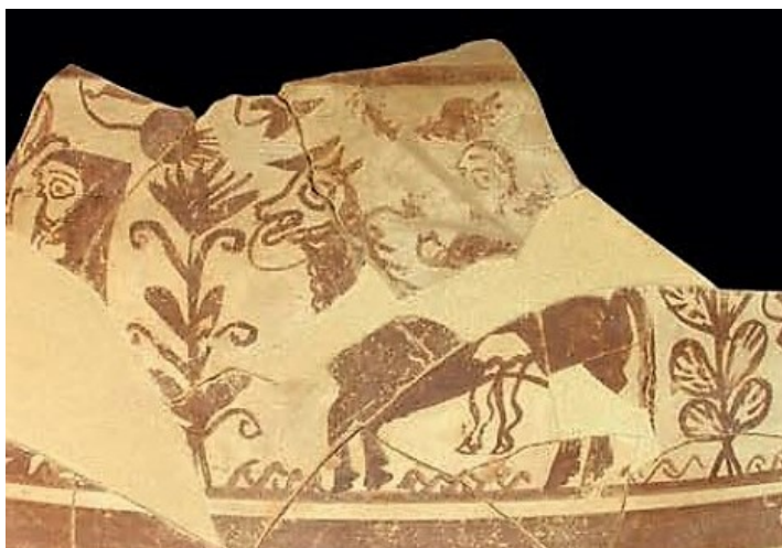
Figura 5. Vaso de Sant Miquel de Lliria. Mata et al. 2014: 208.

Es más, reparemos en que esta manera de concebir el tránsito psicompompo se prolongó mucho más que la costumbre de erigir grandes conjuntos escultóricos en las necrópolis. Así, a finales del siglo III y comienzos del II a.C., entre las cerámicas de Sant Miquel de Lliria nos encontramos con dos vasos que no pueden resultar más esclarecedores para nuestros objetivos. En el primero de ellos, un galbo de un recipiente de tipología indeterminada, podemos contemplar a una pareja cabalgando a lomos de un gran caballo engalanado (Bonet 1995: 248). La escena, que tradicionalmente se había considerado una cabalgata nupcial (De Griñó 1992: 200), ya fue reinterpretada por M. Ruiz Bremón (1994) en clave funeraria. El abigarrado universo de flores de loto, espirales y líneas ondulantes a través del que se produce la cabalgata así parece sugerirlo. Mas reparemos, añadiría yo, en que, una vez más, la fémina es más alta que el varón, y en que es ella, y no él, quien maneja las riendas de la montura, llevando a su compañero de viaje a la grupa. Se trata, con toda probabilidad, de una diosa que guía al difunto a través de este Más Allá florido. Y fijémonos igualmente en la sirena que antecede a la pareja en este extraño viaje. El grupo de esta cerámica de Sant Miquel de Lliria remeda de alguna manera el mismo esquema iconográfico, e ideológico, que el representado siglo y medio antes en la escultura del Parque Infantil de Tráfico.