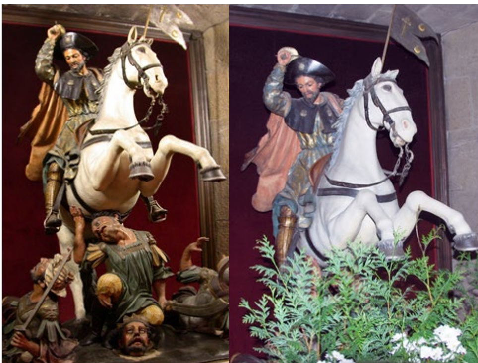
Figure 1. Santiago Matamoros at the side entrance of the Cathedral of Santiago de Compostela: before and after the attempt to hide the lower part of the sculpture.

But just as sight forgets easily, it also uncovers in the most obvious way and can demand concealment. Consequently, there are parts of the body that, from a religious perspective, should be hidden under a wimple (the hair), a habit (the shape of the body), a chador (everything except the eyes) or burka (not even the eyes). This is believed to be the most faithful way of following the divine mandate, though there may be many other reasons. Customs and traditions, for example, are never better safeguarded from unstoppable change than by being named divine law or by being interpreted as such.