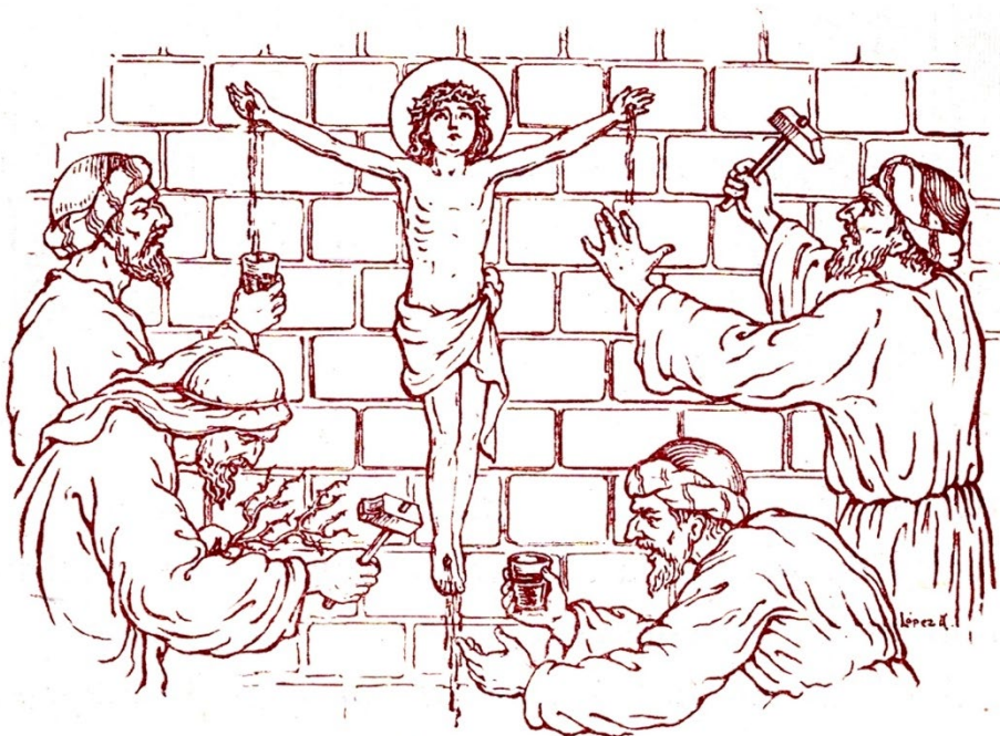
Figure 5. The little boy Dominguito de Val crucified by the Jews of Zaragoza. Drawing by José López Arjona to illustrate chapter 18 entitled “The Jews kill a child” from the book by Agustín Serrano de Haro which was used as the first history book for 6-year-old schoolchildren from 1943 to 1962.