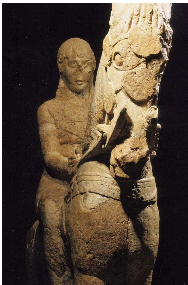
Figura 3. Jinete de la tumba 18 de Los Villares. Olmos 2011: 113.

Un motivo algo distinto, aunque con toda probabilidad perteneciente a la misma esfera semántica, es el del caballo de la cercana necrópolis de La Losa (Casas de Juan Núñez, Albacete). En ella, a comienzos del siglo V a.C. se representó a un caballo guarnecido con una manta con forma de piel de toro rematada en cuatro palmetas y sujeta mediante cinchas, y con un juego de riendas (Sanz y Blánquez 2010: 269). Ahora bien, nadie utiliza tan ricos atalajes, pues el caballo se yergue en solitario, hierático, bien porque originalmente el correspondiente jinete hubiera sido esculpido por separado, tal y como propone T. Chapa (1980b: 857), o bien porque, como sugiere R. Olmos (2011: 116), a imagen de los caballos de Patroclo (Hom., Il. 17.426-440), este équido hubiera sido representando aguardando a su amo desaparecido, esperando quizás junto a su tumba para transportarle al Más Allá.