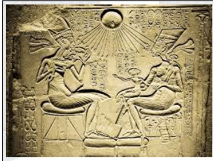
Figura 2. Akenatón, la familia real y Atón. Modificado a partir de Reeves 2005, 47.

Numerosos ejemplos de estructuras (altares, hornacinas, nichos, relieves) y objetos muebles (amuletos, estelas, mesas de ofrendas) han sido encontrados y exhaustivamente estudiados y comparados con otros paralelos por Stevens (2003 y 2006), principalmente (Souto 2019, 5-9). Sin embargo, el funcionamiento del culto y el contexto de estos hallazgos no ha sido siempre fácil de identificar. Las casas de Tell el-Amarna ampliamente estudiadas por Stevens (2006) y Koltsida (2007) entre otros autores, proporcionan un modelo específico adaptado al paisaje y entorno del yacimiento, lo cual implica particularidades que no se dan en otros yacimientos. A su vez, esto significa que no hay un modelo de casa auténtica y únicamente estandarizado, pues depende del poder adquisitivo de sus propietarios y de otros factores. Si bien esto es una realidad, también lo es el hecho de que para realizar analogías comparativas se tiende a equiparar las casas de las élites, las llamadas mansiones de Tell el-Amarna, con las de Kahún (Arnold 1989; Moeller 2007), por ejemplo. Las casas de individuos de estratos sociales inferiores variaban considerablemente frente a estas construcciones, presentando una estructura más sencilla (también por cuestiones de disponibilidad de espacio).