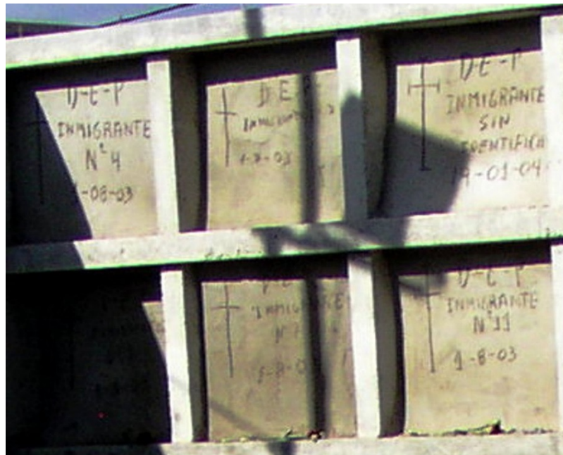
Figure 4. Anonymous niches of drowned immigrants in Tenerife.

Violence of the borders between wealth and poverty, staked out by migrating religions known as transnational, perhaps to remind us that it is the enclosed reserve, the nation, which lends them reality. A global world cut back, compartmentalized and disdainful of outsiders, turning its gaze into a social practice littered with corpses sacrificed at the improvised slaughterhouses of beaches facing the shores of Africa. Insensitivity in our world constructed on the base of plutocratic senses transforming humans in lesser, the less they have—no passport (but see Levitt 2007), no money, therefore nobody.