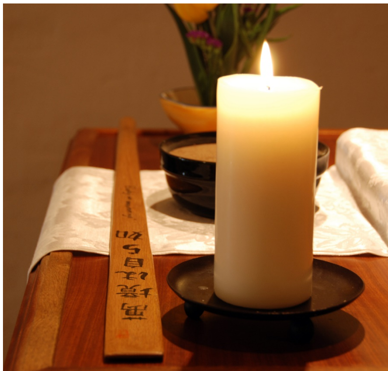
Figure 3. Keisaku at the altar of the Zen dojo in Santa Cruz de Tenerife.

provides a good example. Kensho , “to see truly”, is sought even if it involves submission to the possibility of being beaten. This true sight-insight can be triggered by being hit with keisaku , a stick that symbolises power and annihilation in the meditation room (figs. 2 and 3).