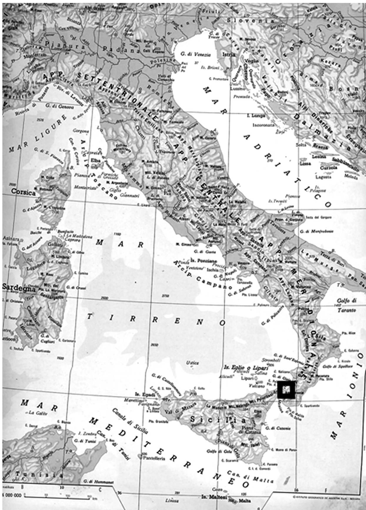
FIG. 1 – LE SALINE: COLLOCAZIONE GEOGRAFICA (DA ZAGARI 2006).