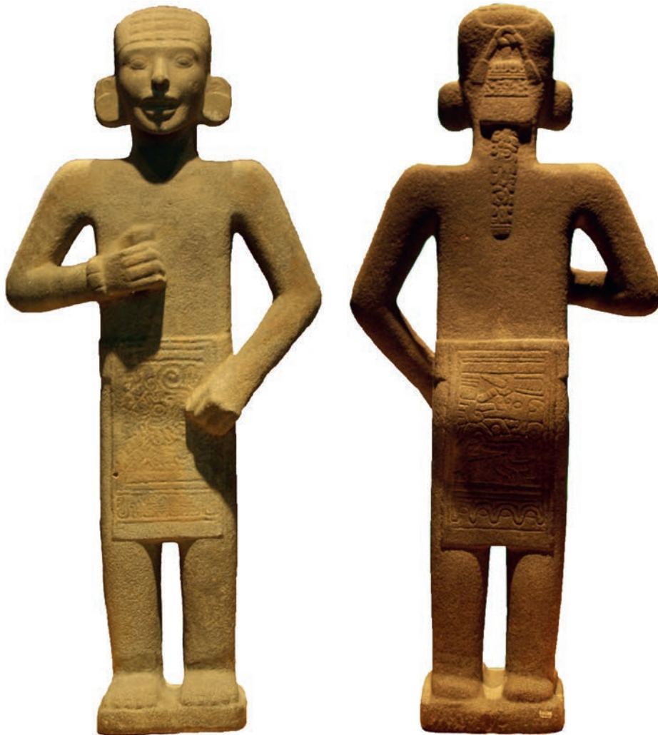
Figura 1. El ‘Adolescente de Jalpan’, vista frontal y vista posterior. Sala del Golfo, MNA.

Inexplicablemente, la escultura hasta ahora no ha sido objeto de un estudio riguroso, a pesar de que me parece una obra de indudable valor simbólico y estético. Parecería que la figura del ‘Adolescente