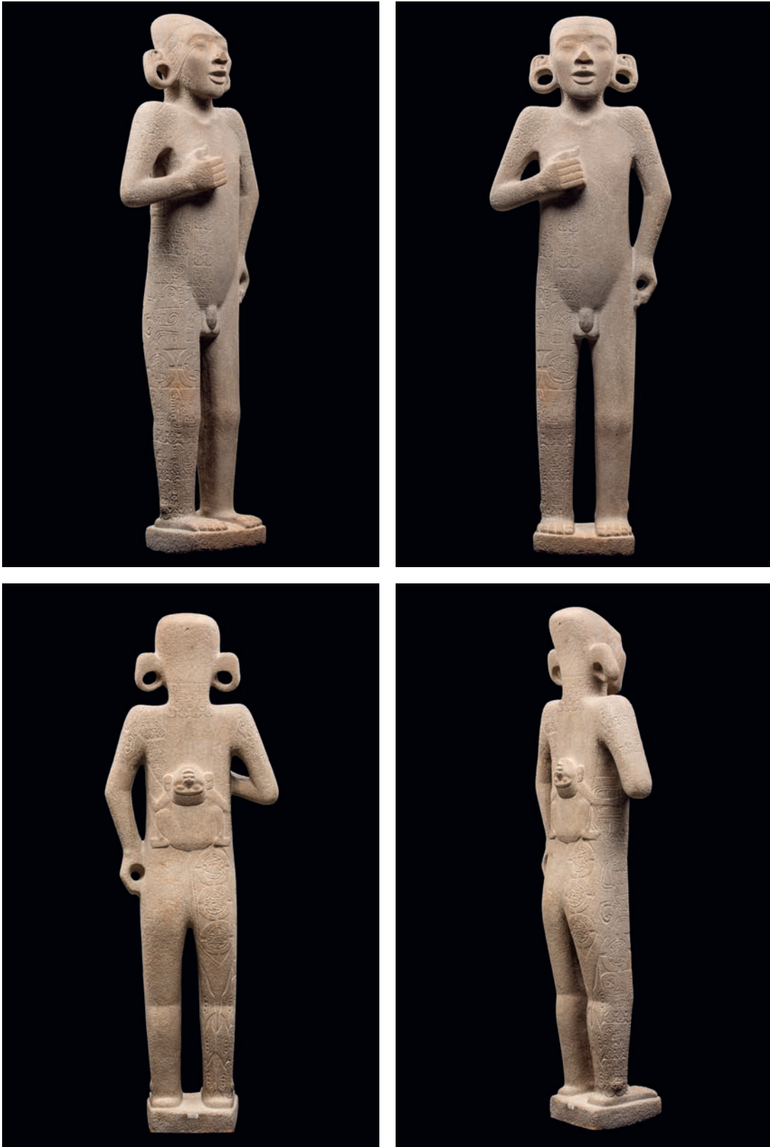
Figura 2. El 'Adolescente Huasteco o de Tamuín', MNA, Ciudad de México, estado actual (junio 2024).