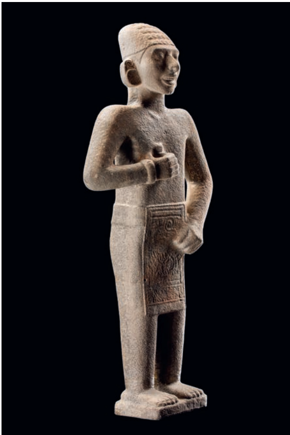
Figura 3. El 'Adolescente de Jalpan', vista frontal. Museo Nacional de Antropología, Ciudad de México (en adelante, MNA). Cortesía del Archivo Digitalizado de las Colecciones Arqueológicas del Museo Nacional de Antropología. Secretaría de Cultura. INAH. MNA. CANON. MEX. Reproducción autorizada por el Instituto Nacional de Antropología e Historia.