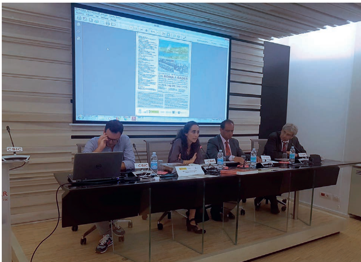
Figura 1. Acto inaugural del coloquio en el salón de actos de la EEHAR/CSIC en Roma.