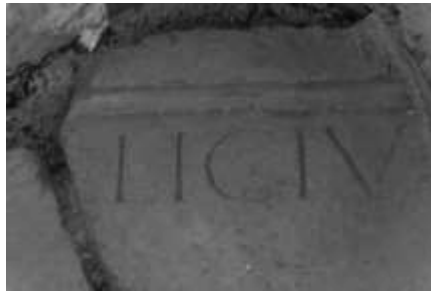
Fig. 1 - Spoleto. Chiesa di San Ponziano. Epigrafe frammentaria rinvenuta in situ (foto autore).