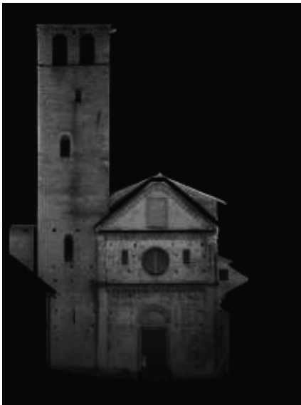
Fig. 2 - Spoleto. Chiesa di San Ponziano. Analisi a laser scanner dell'edificio (elaborazione autore).